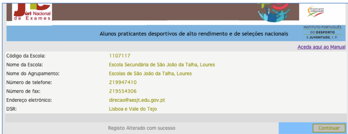
Figura 12. Registo Alterado com sucesso

Abre a janela com a informação Registo Alterado com sucesso (fig. 12).