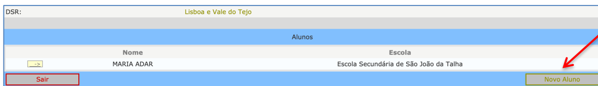
Figura 14. Introdução de Novo Aluno

Ao clicar no botão “Voltar” e de novo no botão “Voltar” , o utilizador pode introduzir o novo registo de aluno (fig. 14).