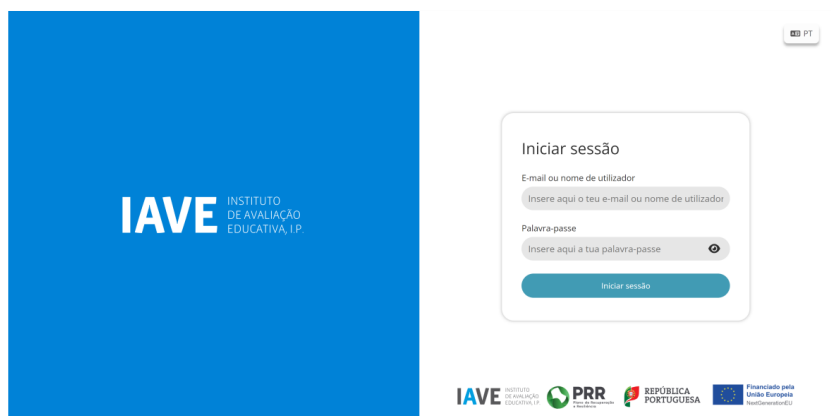
Figura 1 – Acesso à Plataforma de Realização das Provas Eletrónicas do IAVE

c) Inserir as credenciais “Nome de utilizador” e “Palavra-passe” e, em seguida, clicar em “Aceder” ou “Iniciar sessão”.