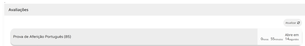
Figura 2 – Acesso à prova a realizar

7.7. Nas restantes provas ao clicar em “Iniciar sessão”, por exemplo, para um aluno que realiza a prova de aferição de Português (85), aparece o seguinte ecrã: